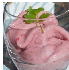
ラズベリー バナナアイス