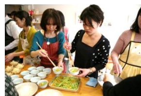
第1弾開催時の様子