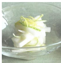
大根とセロリの レモン漬け